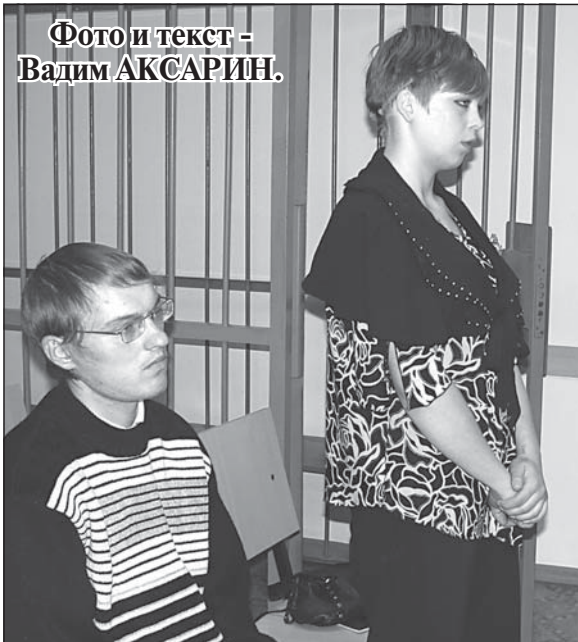
Фото и текст - Вадим АКСАРИН.