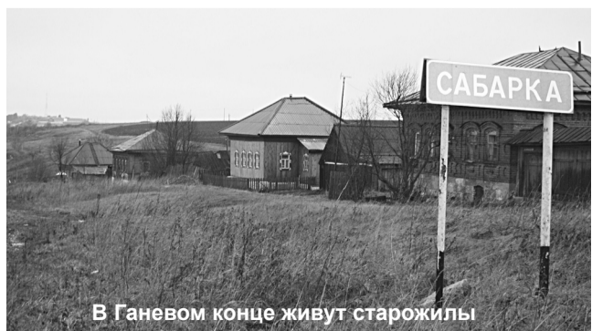
В Ганевом конце живут старожилы