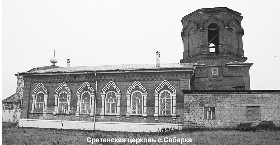
Сретенская церковь с.Сабарка