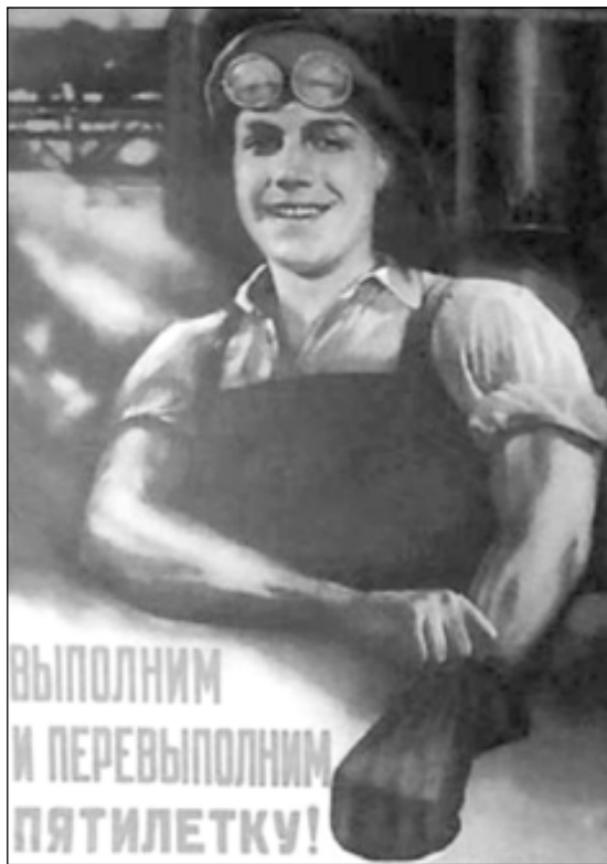
Многие плакаты советской поры славили ударный труд.

К этому времени на Нытвенском заводе из отходов производства было организовано изготовление предметов домашнего обихода. В цехе ширпотреб-