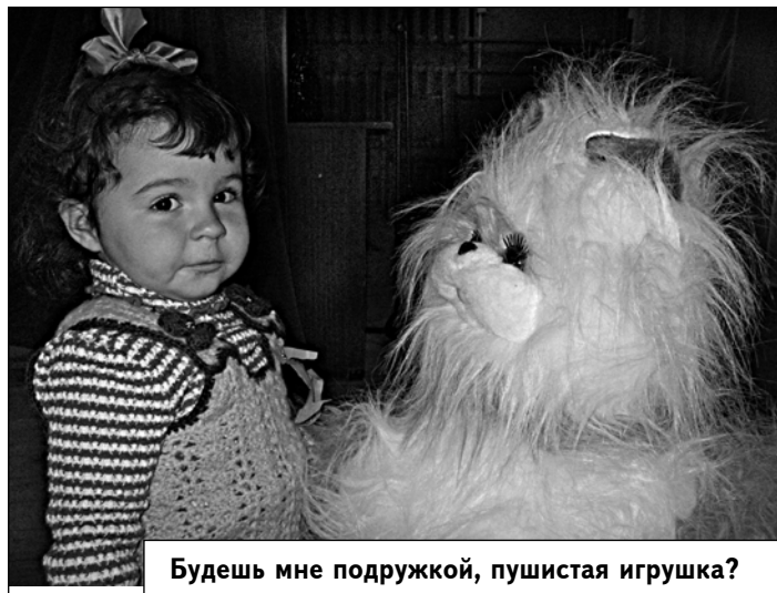
Будешь мне подружкой, пушистая игрушка?