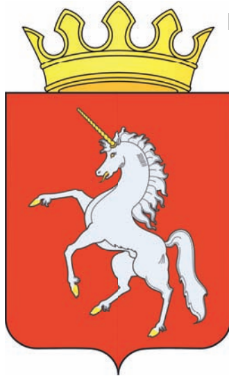
Утвержденная геральдика Лысьвенского района: герб и флаг

получил законное право быть символом Лысьвы