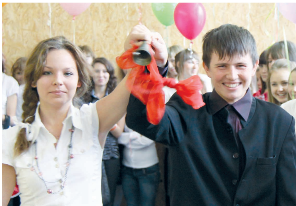
Добро пожаловать в новый образовательный центр!

КАК «ПОКУШАЛИСЬ» НА КОШЕЛЁК И ПСИХИКУ ГРАЖДАНИНА → стр. 4