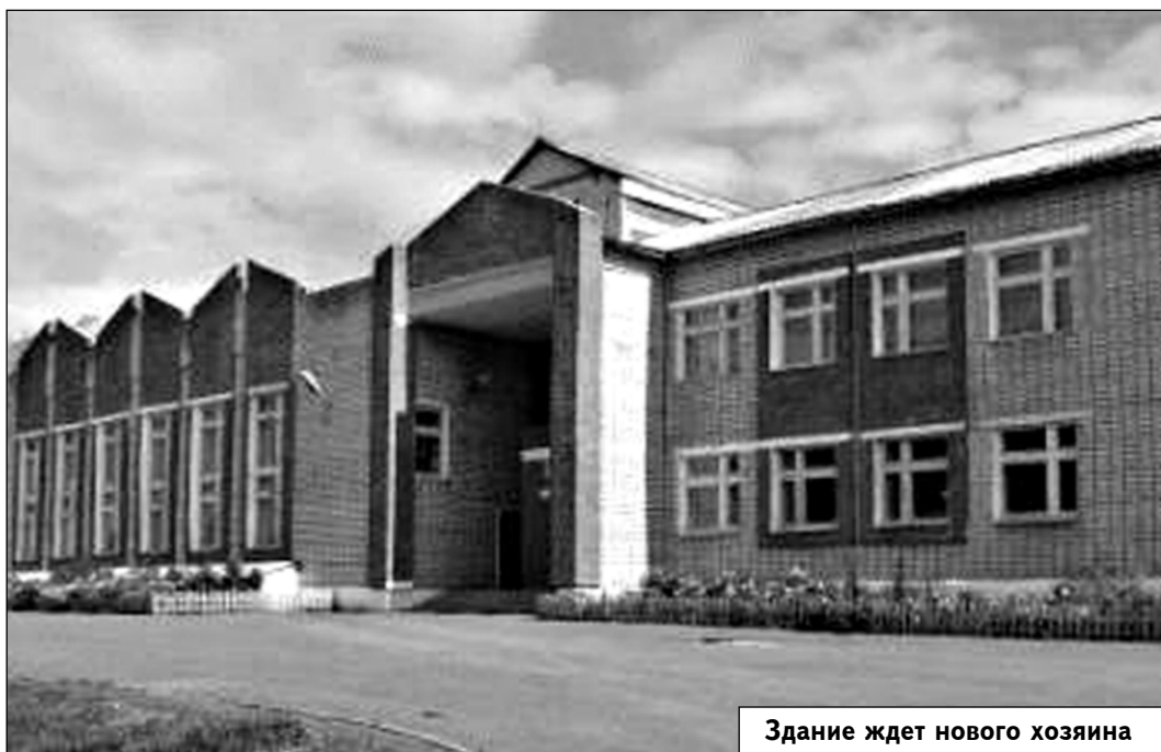
Здание ждет нового хозяина