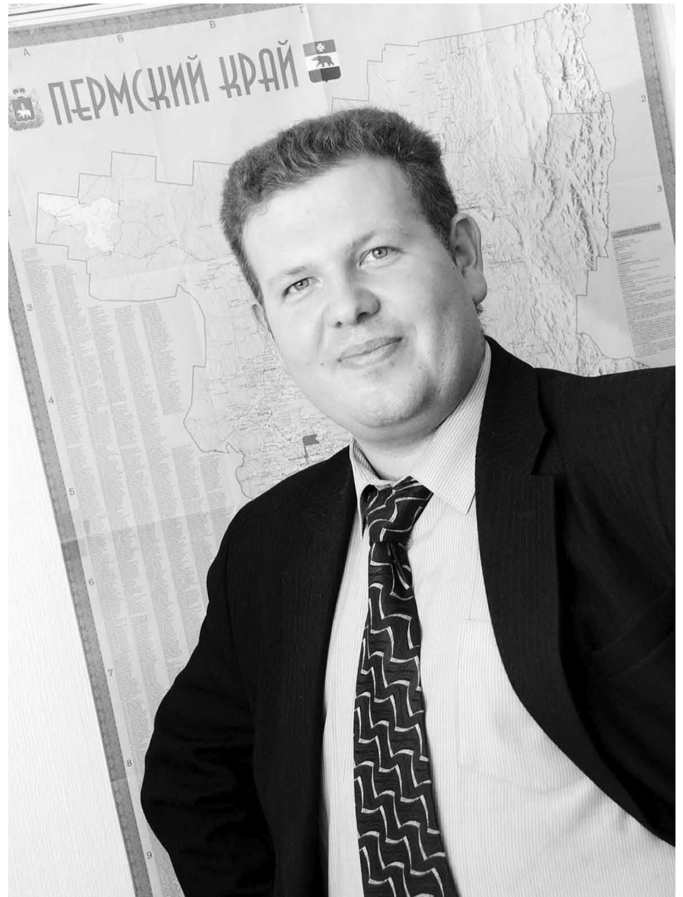
Сейчас кадры, которые выпускает наша фармакадемия, одни из лучших в отрасли.

Последний раз я был в больнице наверно еще в школе. Таблетками не увлекаюсь и стараюсь жену и дочь тоже сильно к таблеткам не приучать. Простуду и кашель на начальных стадиях стараемся пресечь фитотерапией. Это ингаляции с эфирными маслами, масло шалфея, эвкалипта,