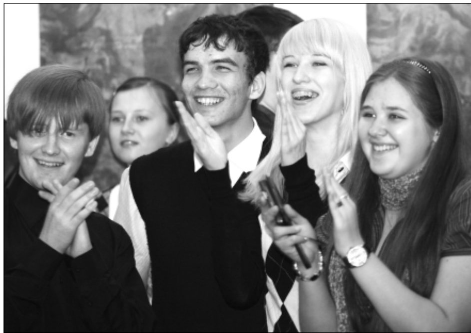
Наши отличники умеют не только хорошо учиться, но и хорошо отдыхать.

– Ведь для того, чтобы получать эту поощрительную выплату, необходимо иметь в зачетке