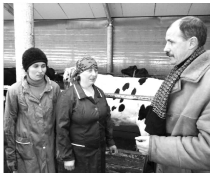
Работники ООО «Дубровинский» в этом году достигли хороших результатов по надою молока.