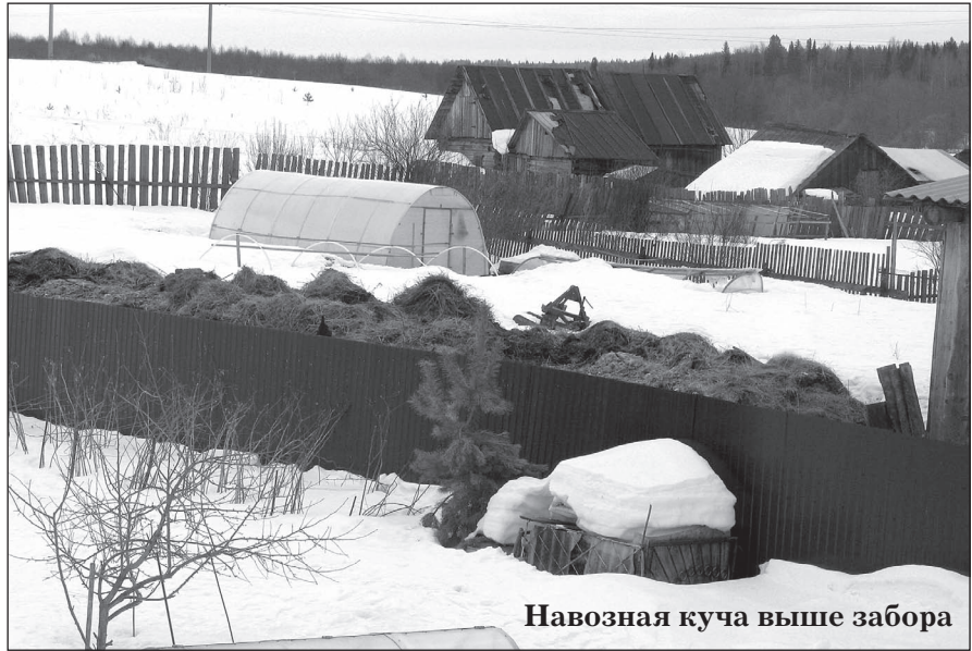
Навозная куча выше забора

Казалось бы - всё, вынесен приговор. Скот - долой, навоз - туда