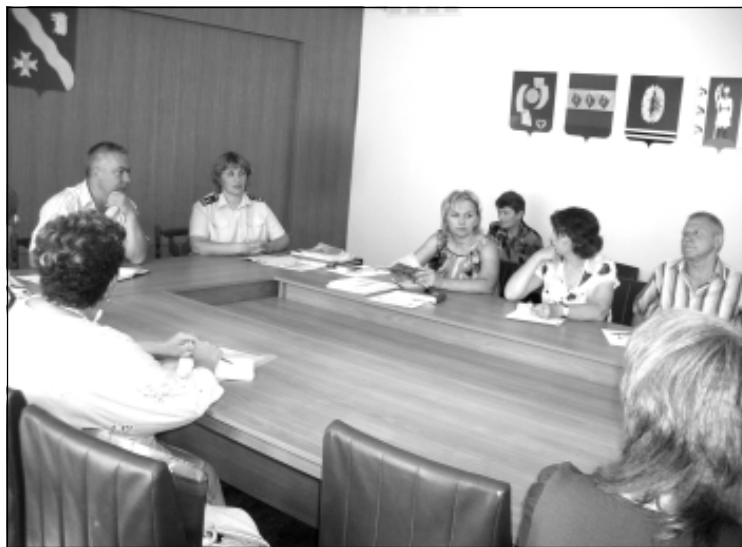
В ходе «круглого стола» завязалась оживленная дискуссия.

Один раз в год управляющая компания или ТСЖ обязаны отчитываться перед жильцами. На общедомовом собрании они опреде-