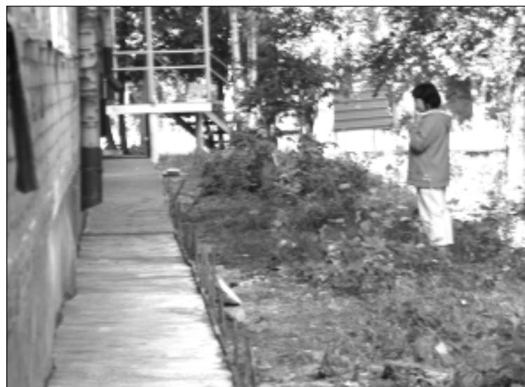
Дом № 15 на пр. Ленина был построен одним из первых. За годы эксплуатации многое в нем поизносилось, поэтому управляющая компания постоянно производит здесь ремонтные работы. Вот и сейчас заливают новые отмстки по всему периметру здания.

от прошлых лет внешний облик многих домов меняется в лучшую сторону. Да и объемы капитального ремонта жилого фонда заметно возросли. Нынче на эти цели будет израсходовано более 48 млн. рублей. В «Альтернативе» рассчитывают, что эта федеральная программа будет действовать и дальше, что позволит улучшить качество жилого фонда.