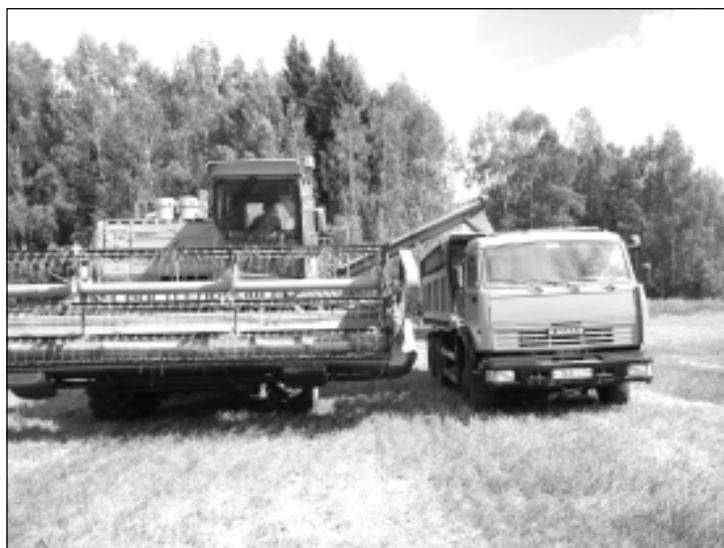
Потоком идет зерно нового урожая.