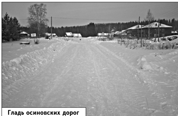
Гладь осиновских дорог