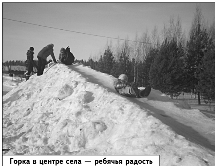
Горка в центре села — ребячья радость

Хочется отдельно поблагодарить еще одного жителя села Осиновик. В декабре, когда планировались новогодние