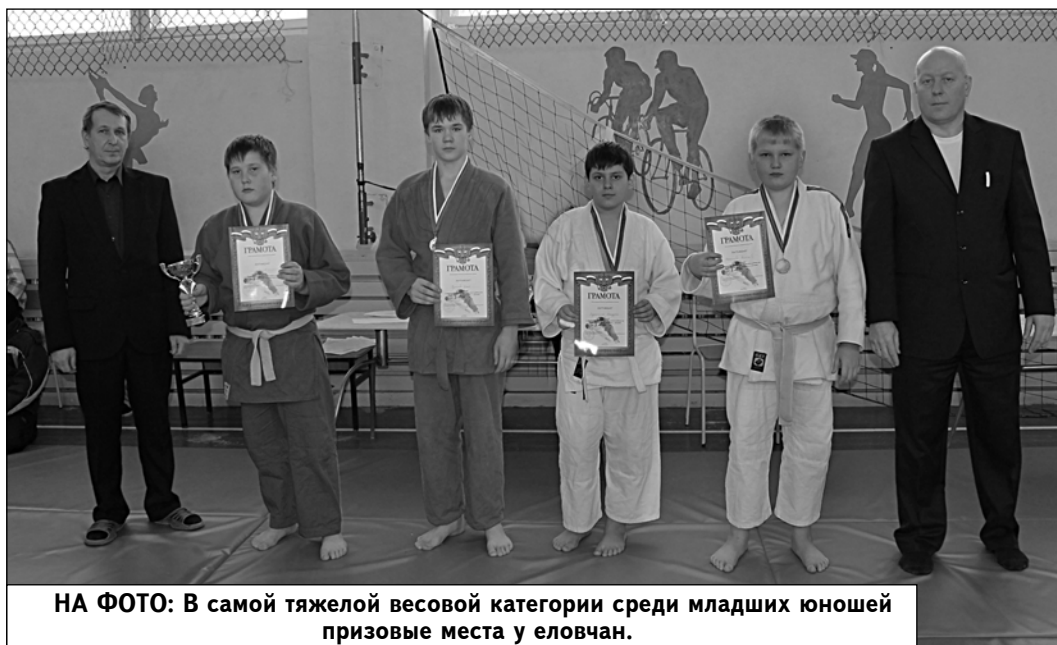
НА ФОТО: В самой тяжелой весовой категории среди младших юношей призовые места у еловчан.