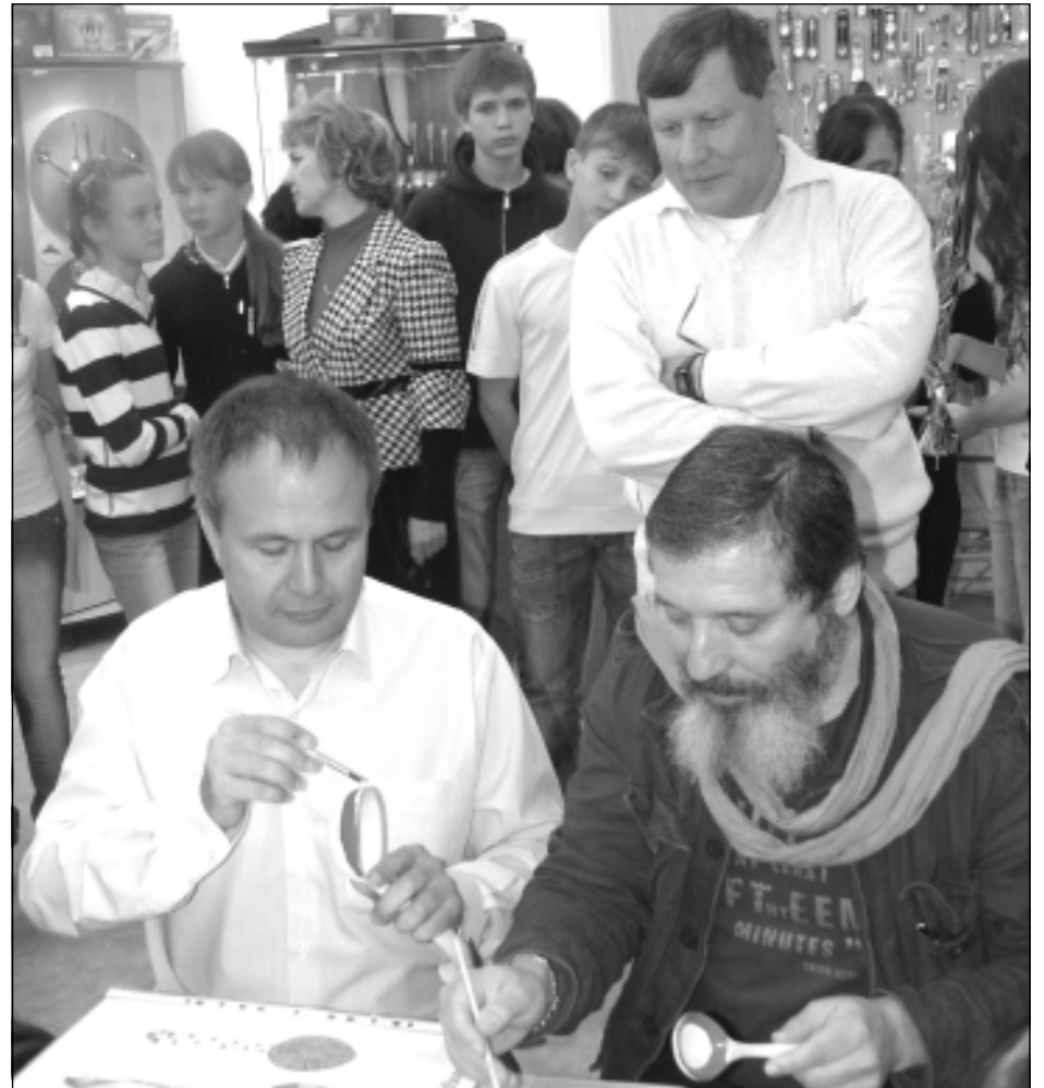
В музее ложки сама атмосфера располагает к творчеству.