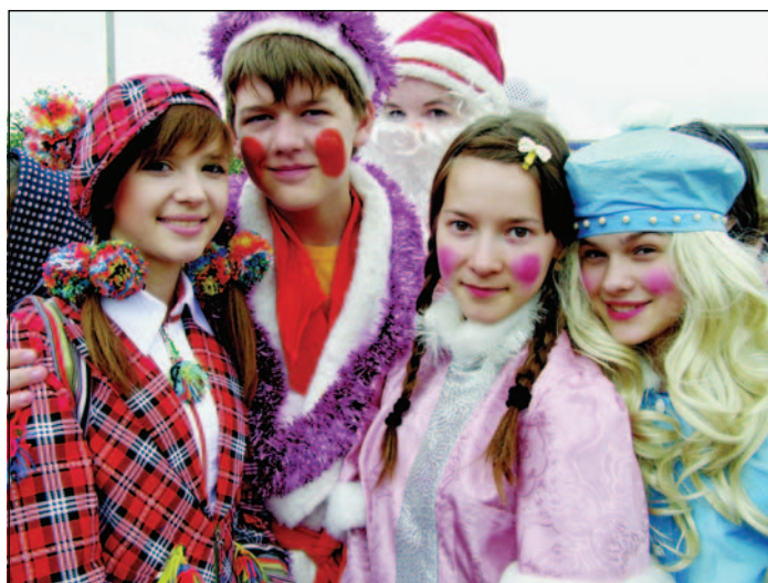
Участники конкурса детских площадок

На меня на площади «напало» огромного роста чудо-лицедей-милиционер. Трёх-