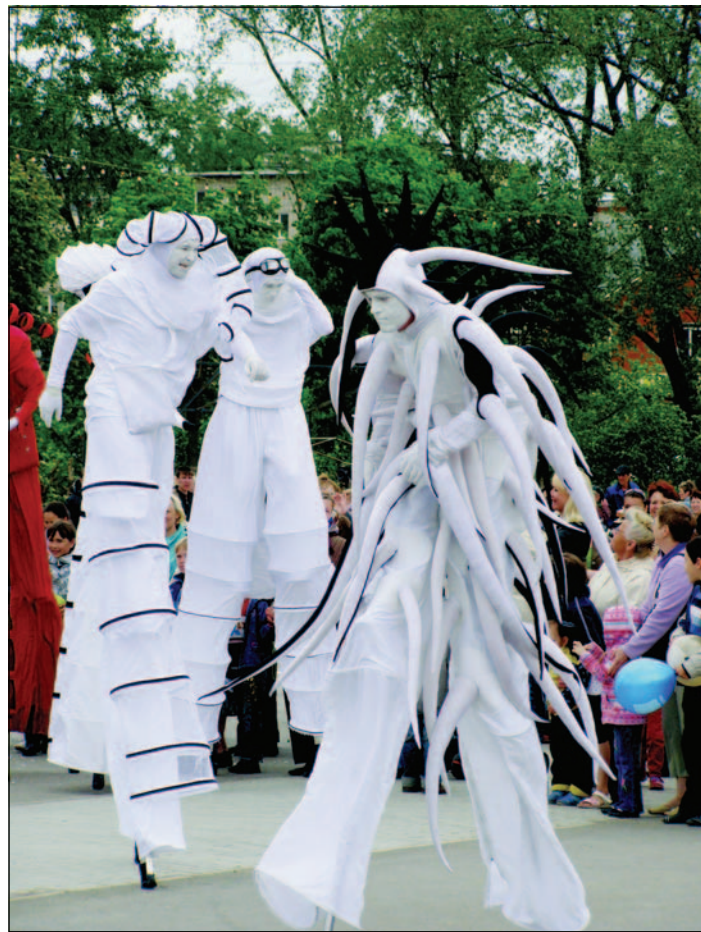
Труппа «Высокие братья»

го праздника, приуроченного к открытию летнего оздоровительного сезона.