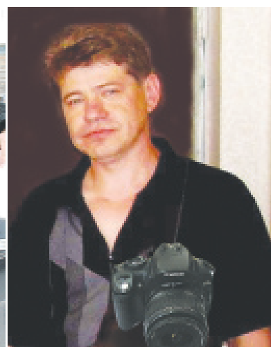
О коллеге вкратце скажем: Он - корреспондент со стажем!