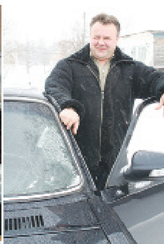
И в зной, и в холод он не дремлет - Везет и в город, и в деревню!