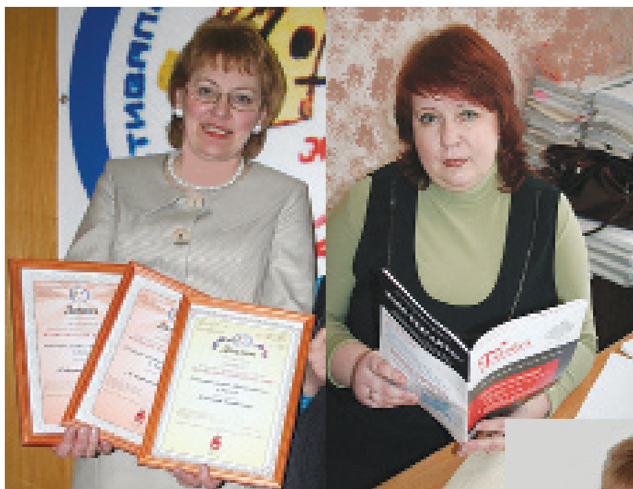
У ней в руках - успех газеты Ей коллектив - помощник в этом!