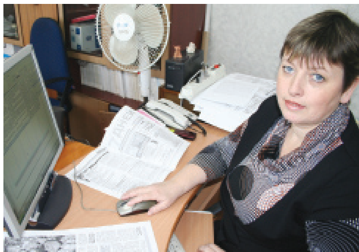
Её конёк - дизайн районки, - И это дело знает тонко!