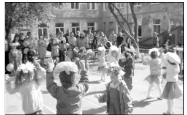
Танец цветов в исполнении детей средней группы.

В наш детский сад родители ведут своих детей с удовольствием. На вопрос «Почему?» отвечают: «Уютный, добрый, зеленый детский сад. Здесь работают любящие воспитатели, большие выдумщики, которые проводят интересные мероприятия». Эти высказывания дорогого стоят: о нас говорят, к нам хотят попасть. А это значит, что наш труд востребован, оценен теми, для кого мы живем и работаем, – детьми и их родителями.