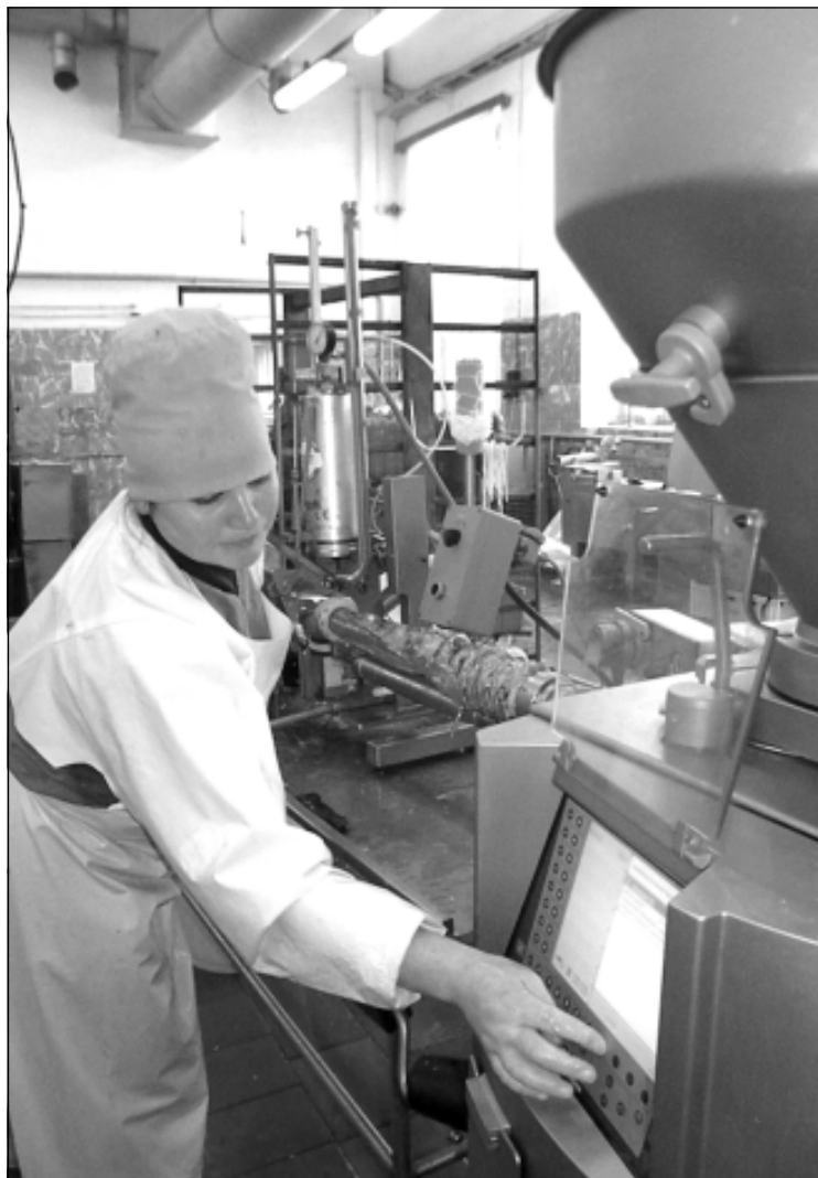
Новый шприц-наполнитель в работе.

Но это еще не все: уже на следующей неделе в специально подготовленном для этой