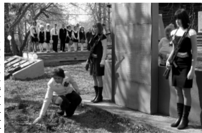
Праздник Победы в селе Ивановском