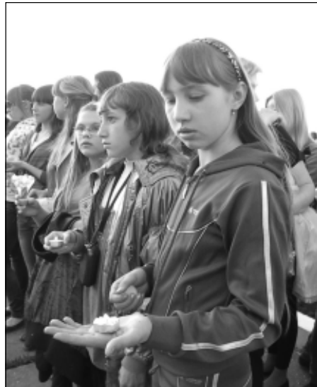
Свеча – дань памяти павшим за Родину.