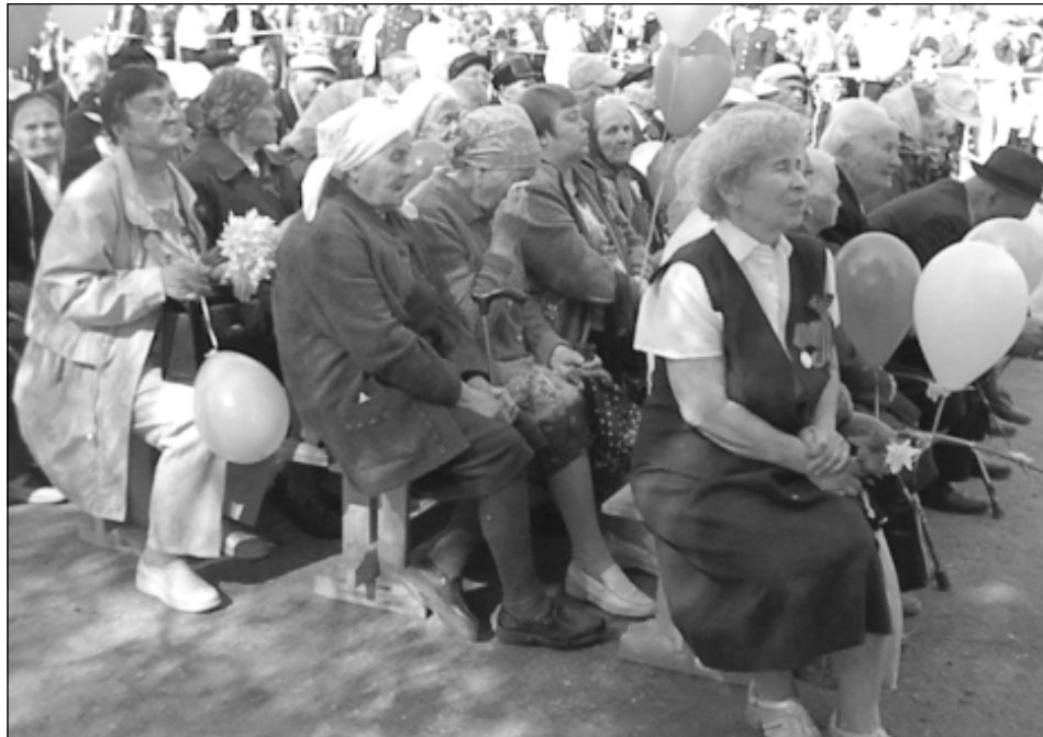
Сдержат слезы в этот день ветераны не смогли.