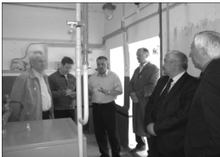
Участники официальной церемонии газификации ООО «Нытвенский мясокомбинат» осматривают оборудование одной из газовых мини-котельных.