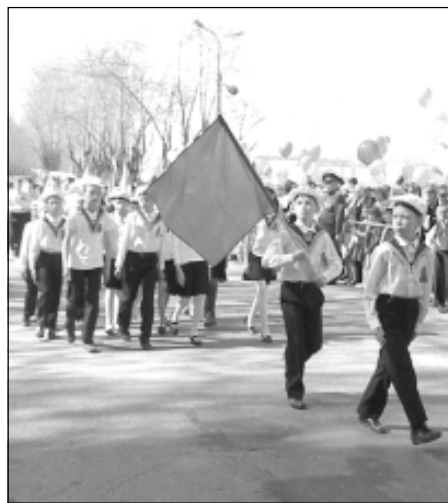
Праздничный парад юнармейцев.

Победители 68-ой легкоатлетической эстафеты на призы районной газеты «Новый день»