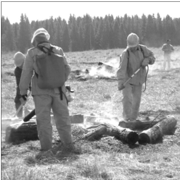
В разгаре ликвидация пожара.