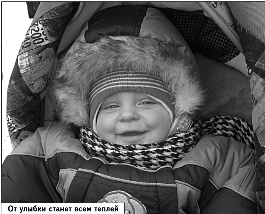
От улыбки станет всем теплей