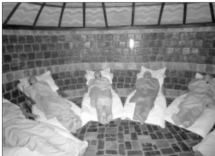
В спелеокамере приятно и полезно вдохнуть лечебный воздух соляной шахты.

проживанием — 60. Лечебная база в состоянии удовлетворить потребности различных групп населения. Она подойдет как для реабилитации инвалидов, больных с хроническими патологиями, так и для вполне здоровых людей.