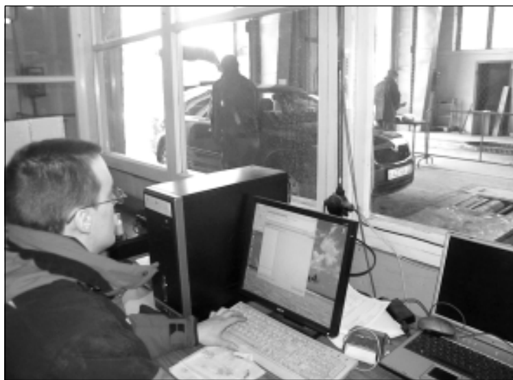
Теперь пройти диагностику в ООО «Нытва» можно в любое время, в т.ч. в выходные дни безо всяких очередей.