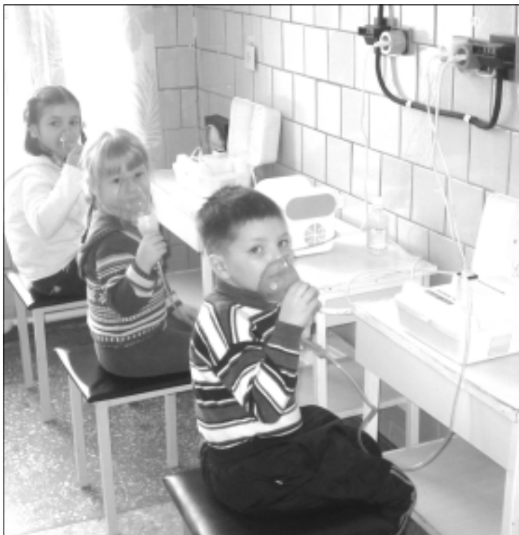
Дети на процедуре ингаляции.

Сегодня одновременно в профилактории может лечиться около 100 человек, в том числе с