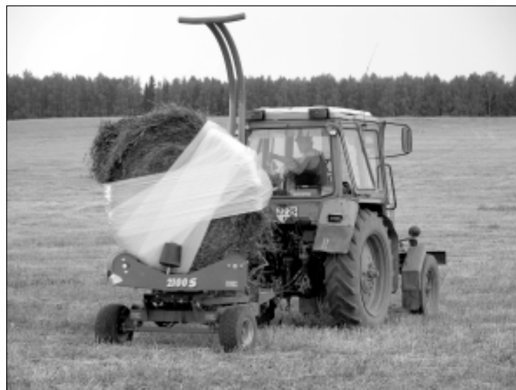
Эти агрегаты, приобретенные у ООО «Нытва», до сих пор используются в ряде хозяйств нашего района.

техосмотра у нас останется на прежнем уровне, то в ВТО нам не попасть. И надо сказать, что за последнее время в этом направлении сделаны серьезные шаги. Сегодня уже не надо предъявлять медицинские справки, нет директив проверять номера двигателей, при техосмотре мы предлагаем владельцам самим или за небольшую плату устранить в наших боксах неисправности, либо сделать это в любое удобное время. У нас теперь нет никаких очередей, как раньше, и функции работников ГИБДД сводятся к выдаче техталона на основании диагностического заключения наших экспертов. О времени техосмотра заказчики могут сообщить по телефону, факсу либо электронной почте, мы всегда готовы принять их и после окончания рабочего дня, а также в выходные дни. К тому же при крупном ремонте мы теперь имеем возможность (и лицензию) менять весь агрегат (например, двигатель), что в разы ускоряет сам процесс ремонта. О популярности нашей фирмы гово-