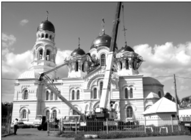
Умельцы ООО «Нытва» за установкой куполов на Култаевском храме.