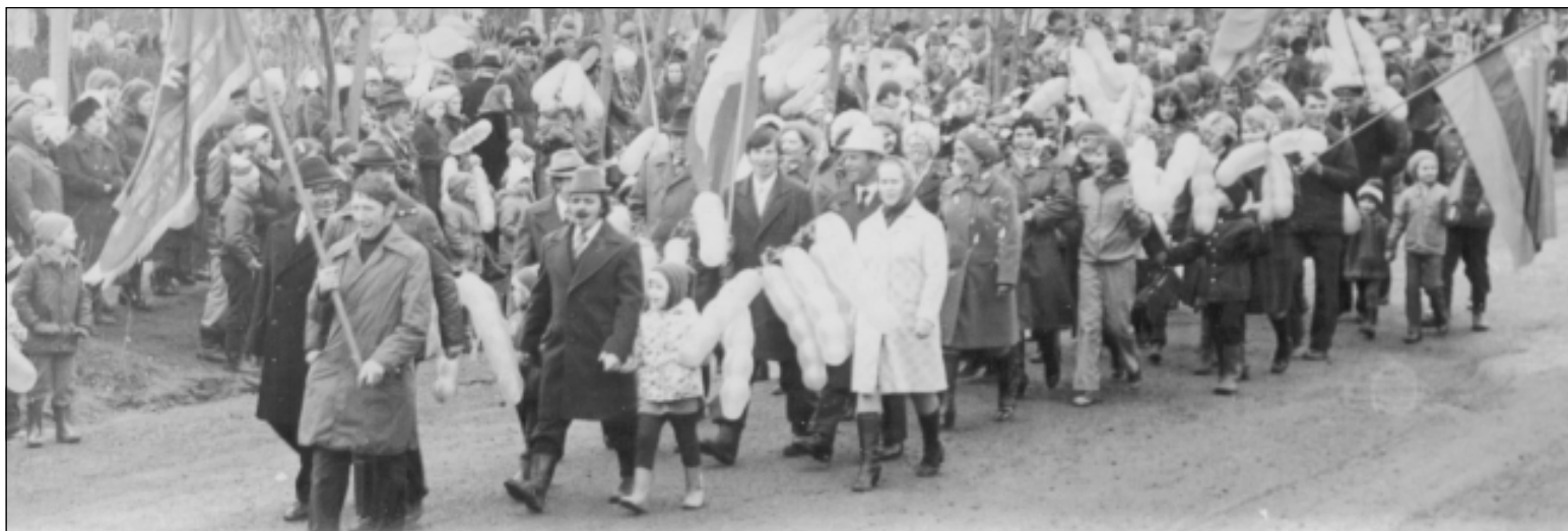
В советские времена народ выходил на городскую площадь два раза в год: 1 мая, чтобы отметить праздничным шествием День международной солидарности трудящихся, и 7 ноября — в годовщину Великой Октябрьской социалистической революции. На митинги собирались тысячи нытвенцев: школьники, студенты, рабочие и инженеры, врачи, учителя, строители и колхозники под звуки бравурных маршей и здравниц с трибуны рядами и колоннами дружно вышагивали по городской мостовой, гордо неся в руках флаги и транспаранты...