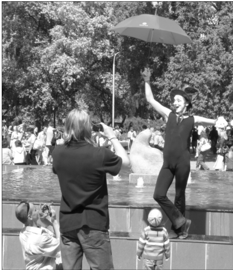
Яркие краски праздника.

Главная задача культурной столицы – стать центром притяжения туристов. «Живая Пермь» – фестиваль, проходивший в Перми в 2009 и 2010 годах, – дал отличные результаты. В