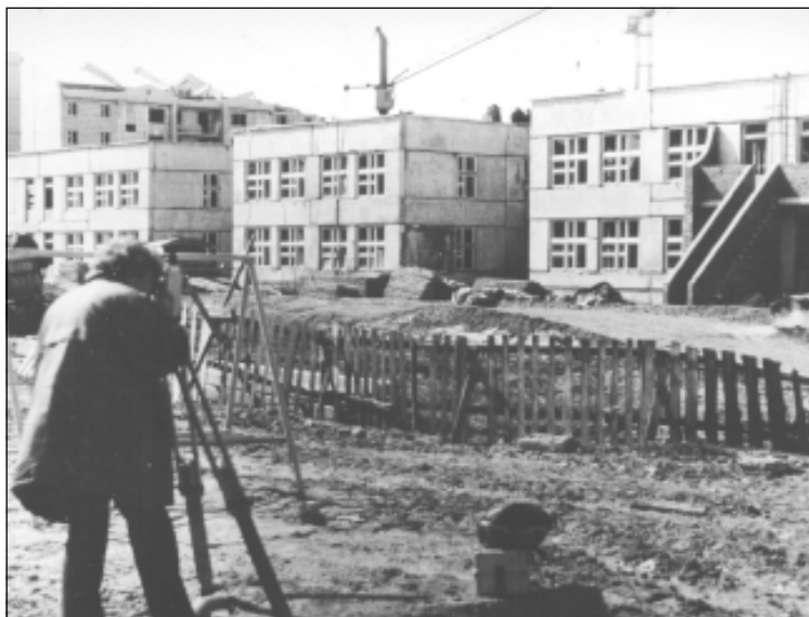
За 80-е годы в Нытве были выстроены десятки объектов соцкультбыта. В том числе и здание, где в дальнейшем разместился санаторий-профилакторий «Волна»...