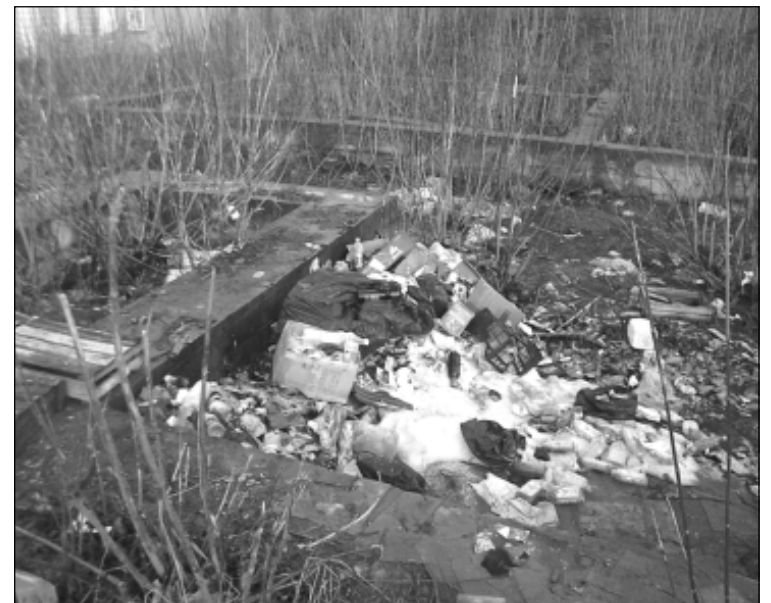
Весной город превращается в одну большую свалку.