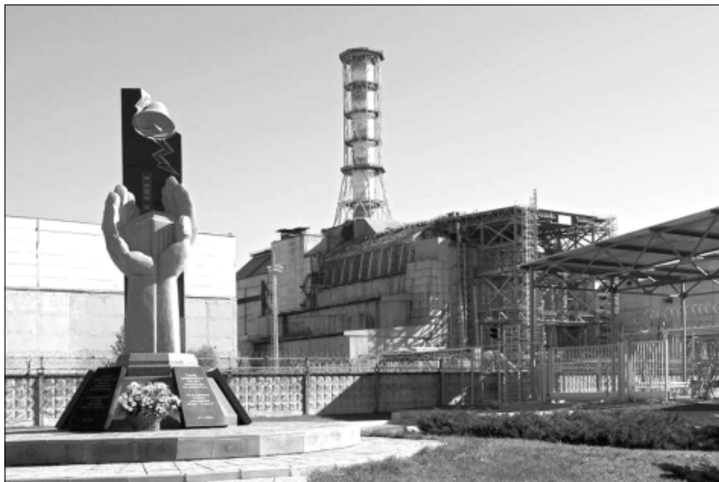
Чернобыльская АЭС сегодня.

разрушены разгрузочная сторона реактора, подпиточный отсек и часть здания. Осколки активной зоны упали на крышу реакторного и турбинного зданий.