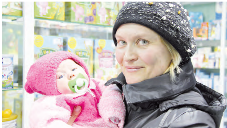
В «Аптеке от склада» - всей семьей

*ежедневно. Приз - тепловентилятор. Выдача призов ведется в «Аптеке от склада» на ул. Смышляева, 44.