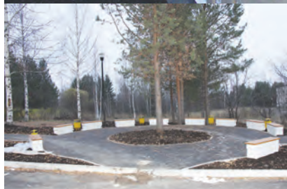
А весной здесь появятся цветы

таж сантехнического оборудования, уже смонтировали системы отопления и вентиляции. Специалисты ООО «СМУ» (г. Лысьва) завершают остекление теплового перехода (кстати, именно эта фирма выполняла работы по монтажу окон и дверей, строительству перегородок в помещении).