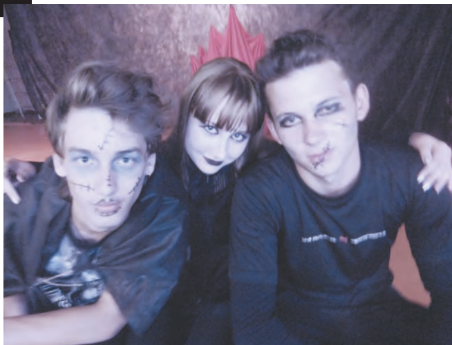
«Юность» дает простор для творчества

А каков футбольный матч между сборными Германии и России! Это вам не чемпионат Евро-