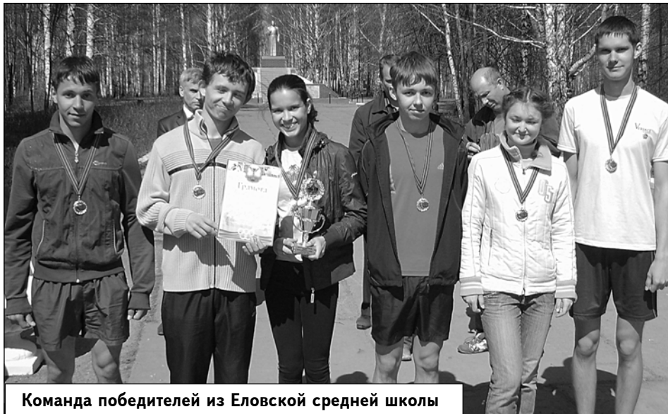
Команда победителей из Еловской средней школы