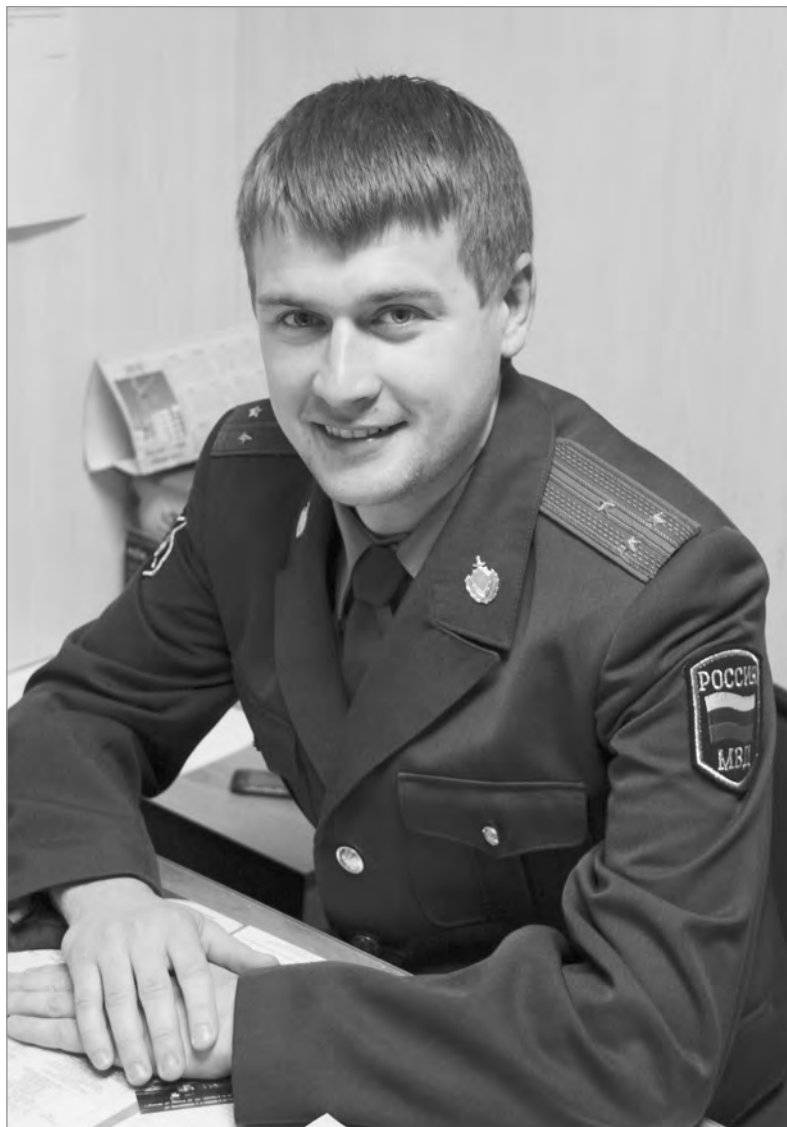
По профессии – сыщик, по жизни – обаятельный молодой человек