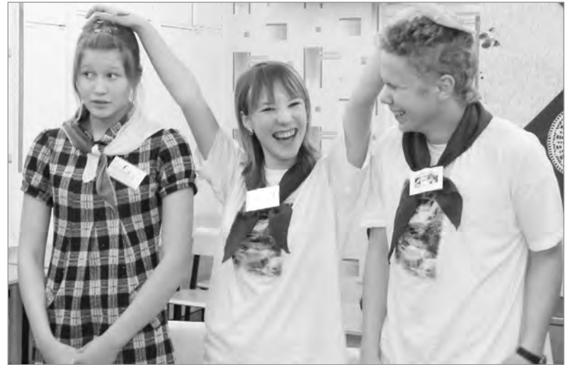
Расти большой, активист!