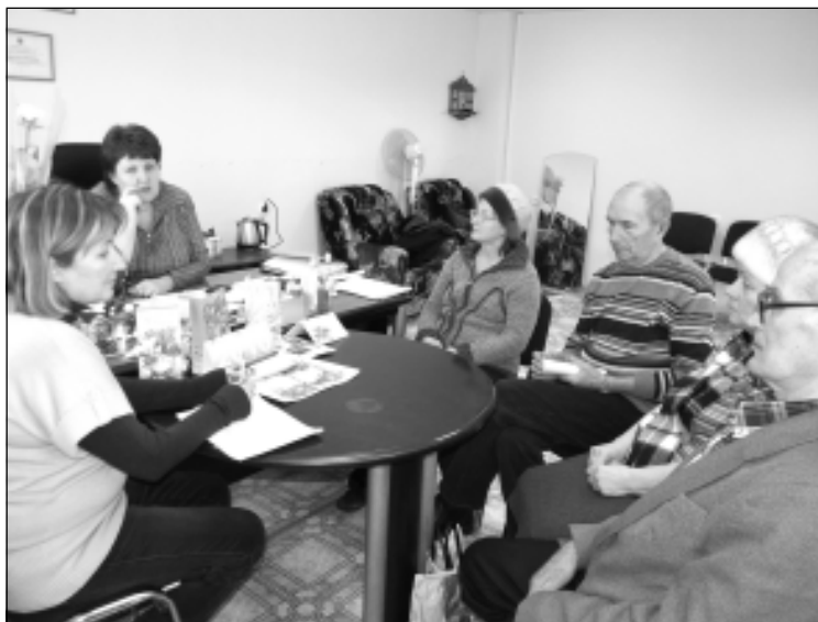
Есть чем поделиться и что рассказать друг другу представителям собственников домов – постоянным партнерам управляющей компании «Альтернатива».

– Приведу только два примера, которые наглядно говорят о тесном контакте и взаимопонимании, которые сложились у нашего дома с управляющей компанией. Когда мы вместе с жильцами соседнего дома № 10 решили своими силами восстановить и благоустроить детскую площадку, возникло немало проблем. И «Альтернатива» оказала конкретную помощь и поддержку. Бесплатно установила нам качели, помогла сделать двойные рамы в одном из подъездов вместе с одной из пенсионерок. Мы всегда находим общий язык со специалистами компании во время проведения текущего ремонта, они чутко реагируют на наши просьбы, выполняют любое требование. Сейчас слесари