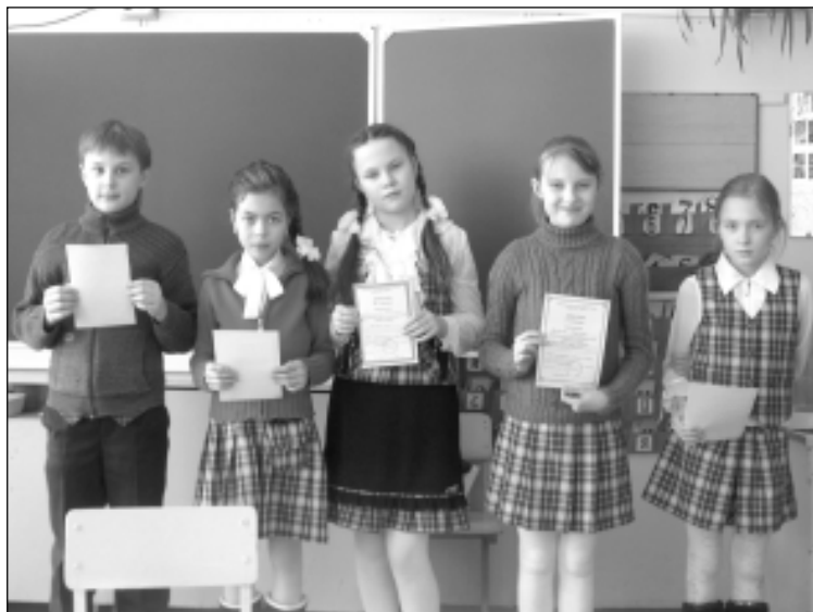
Юные исследователи из гимназии.

Оказалось, что предмет исследования ребята выбирали сами, и, думаю, им это неплохо