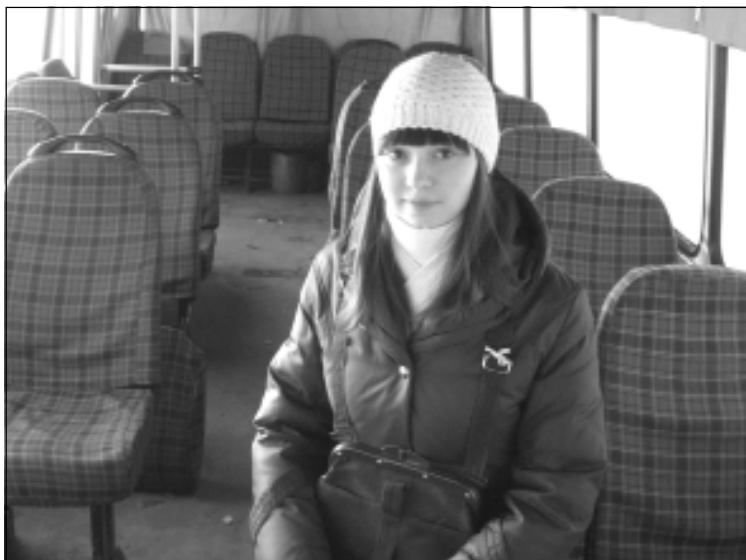
Через несколько минут салон автобуса вновь будет наполнен пассажирами.

До АТП нас везут на служебном автобусе. В центре смотрю