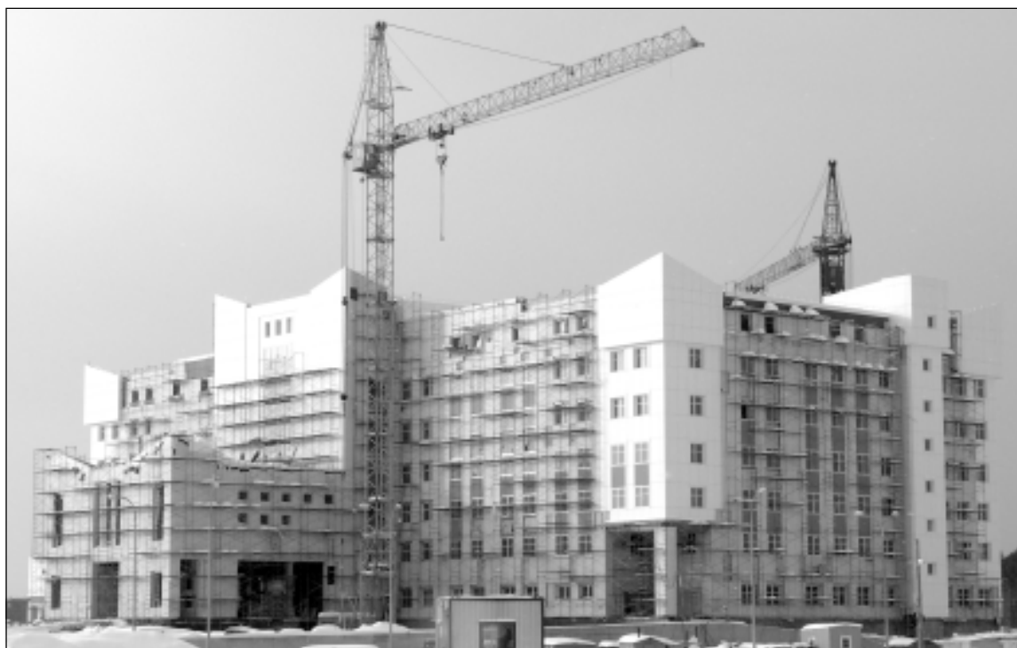
Рядом с федеральным кардиоцентром вырос краевой перинатальный центр.

ном контроле. Здание кардиоцентра построено как бы в две ступеньки. Главное здание имеет 5 этажей. Корпуса – по 4 этажа. Сейчас внешняя отделка здания продолжается. Параллельно строители ведут внутреннюю отделку помещений – готовят палаты и операционные под монтаж высокотехнологичного медицинского оборудования.