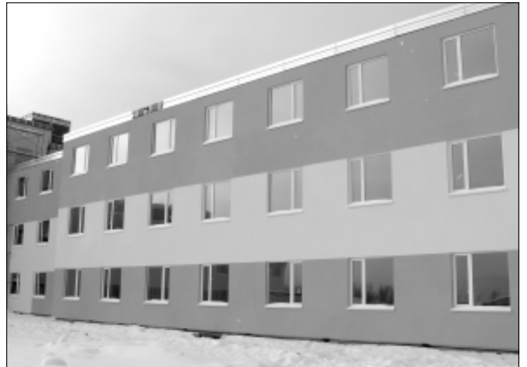
Бирюзово-песочный фасад отличает пермский кардиоцентр от тех, что строятся в других регионах.

Краевой перинатальный центр рассчитан на 130 мест. В нем планируется вести наблюдение, диагностику, лечение и послеродовое сопровождение мам и новорожденных.