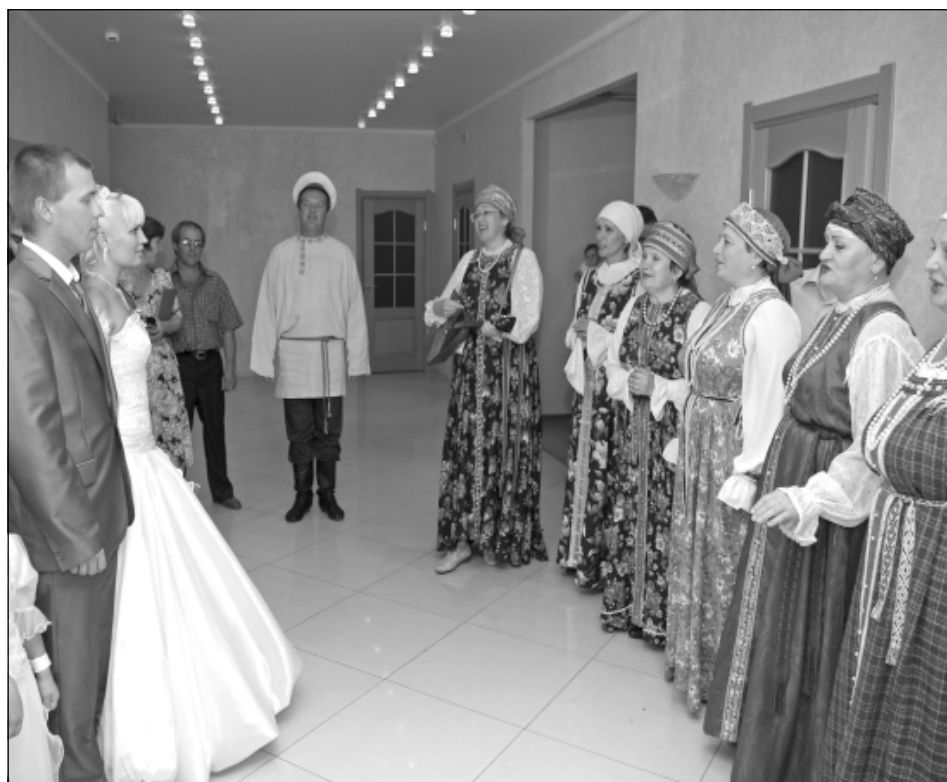
Теперь бракосочетания и в Нытвенском ЗАГСе проходят в духе русских традиций благодаря творческому участию в этих обрядах ансамбля «Забава».

Возьмем для сравнения две цифры. В 2000 году при населении 51,9 тыс. человек родилось 468 младенцев, а в прошлом году при заметно сократившемся населении родилось 593 ребенка.