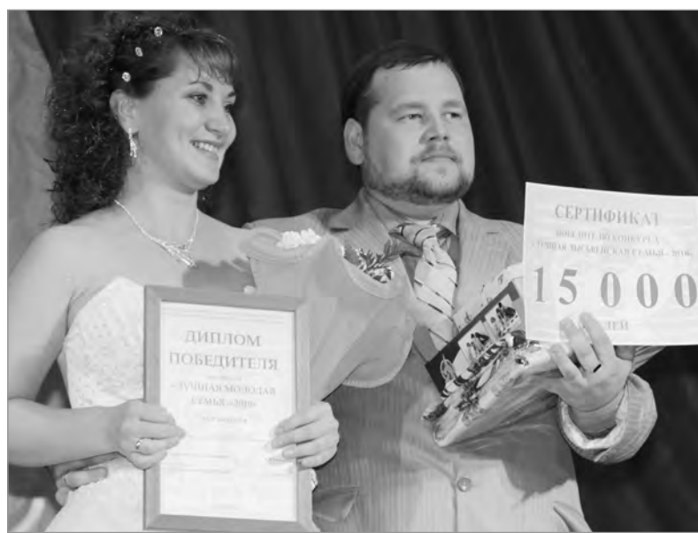
В победителях - снова семья металлургов