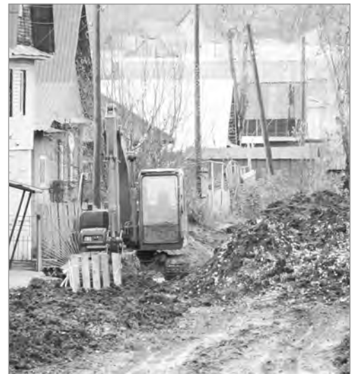
Работают с размахом

Прокладка новой ветки водопровода практически закончена. Как сказал мастер, в ближайшие дни траншеи будут засыпаны. А дальше – планировка дороги и ее отсыпка щебнем и уплотнение.