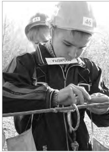
Узелок завязается...

В том же порядке команды Новорождественского, школы № 16 и лицея поднимаются на пьедестал почёта по итогам всех испытаний. По домам довольными разъезжают все, даже те, от кого удача на этот раз отвернулась. Азарт соревнований ещё долго будет будоражить ребячьи умы.