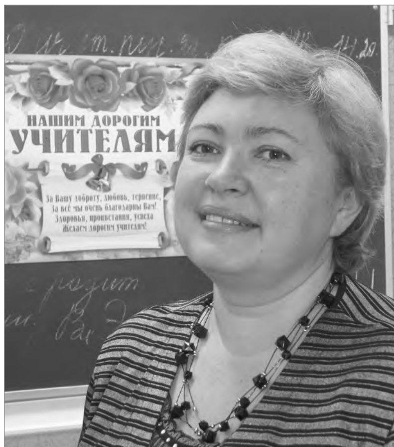
Для настоящего учителя бывших учеников не бывает

Уже 20 лет Елена Геннадьевна работает в школе № 6 (из них пять с половиной - в должности заместителя директора). На её уроках всегда интересно, поэтому очень часто